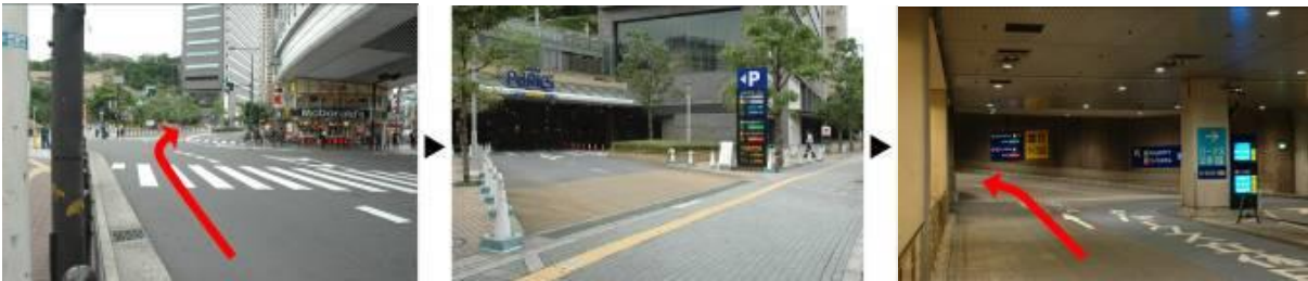
1. 난바 나카 교차로 2. 난바 파크스(Namba parks) 주차장 입구 3. 주차장 안에 스위소텔 주차장 방향