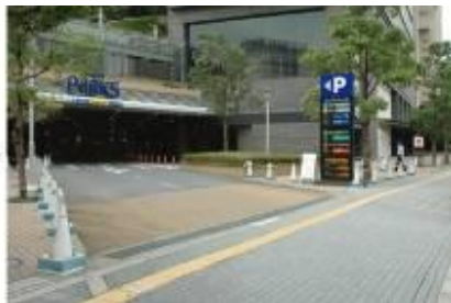
2. 난바 파크스(Namba parks) 주차장 입구