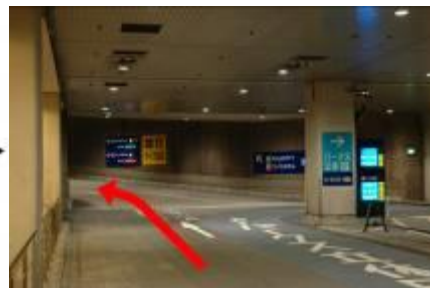
3. 駐車場内分岐にて左へ