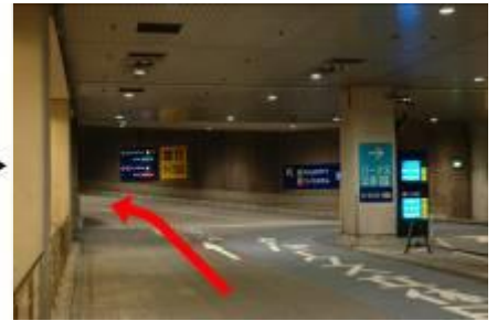
3. 駐車場内分岐にて左へ