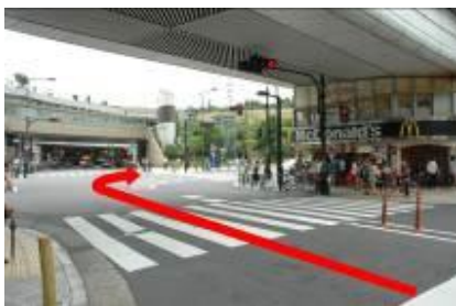
1. 난바 나카 교차로