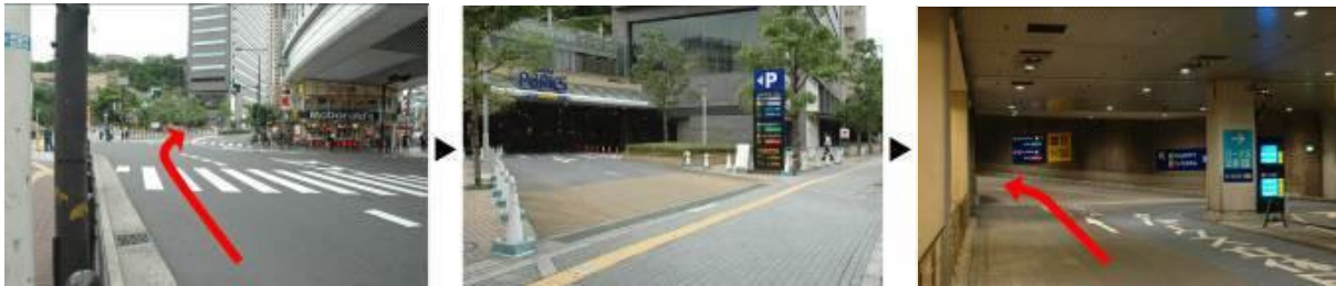
1. 난바 나카 교차로 2. 난바 파크스(Namba parks) 주차장 입구 3. 주차장 안에 스위소텔 주차장 방향