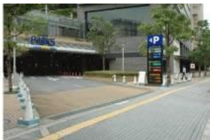
2. 난바 파크스(Namba parks) 주차장 입구